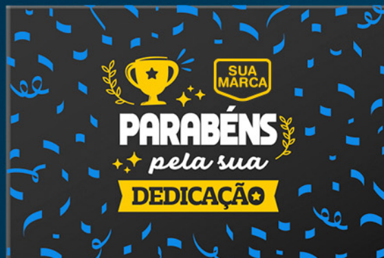
ESTAMPA B: Parabéns pela sua dedicação