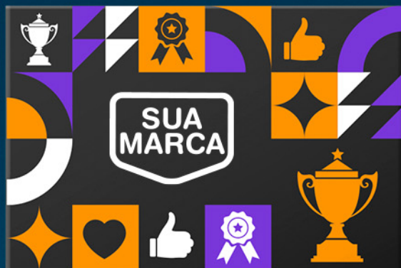
ESTAMPA A: Sua Marca

A coleção traz mensagens de reconhecimento que fortalecem a cultura interna: Cada frase transmite orgulho, motivação e pertencimento.