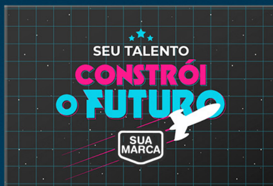
ESTAMPA D: Seu talento constrói o futuro